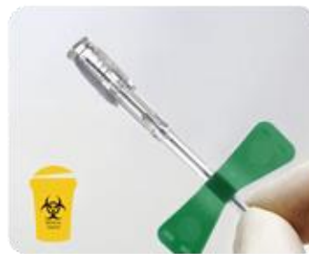
Étape 4: Le clic audible confirmera l'activation du mécanisme. Jeter dans un contenant approprié après usage.