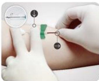
Étape 3: Une fois le prélèvement terminé, utiliser le doigt du milieu pour couvrir le site de ponction avec une gaze. Placer l'index sur l'embout du papillon pour le maintenir en place et tirer la tubulure avec l'autre main pour engager le mécanisme de sécurité.