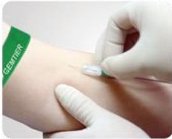
Étape 1: Effectuer la ponction veineuse.