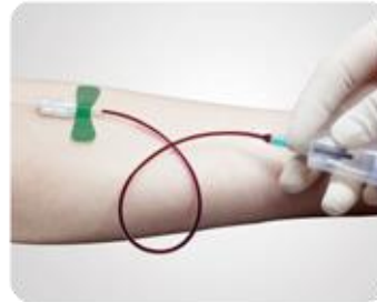
Étape 2: Insérer le tube de prélèvement sanguin.